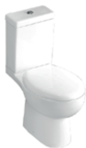
Sanita de chão 660x390x840mm S-Trap: 200mm