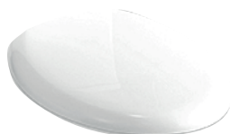
Tampo de queda amortecida 450x375x45mm