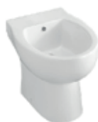
Bidê de chão 530x380x380mm Fixação traseira à parede

A-Entrada de água do autoclismo à escolha